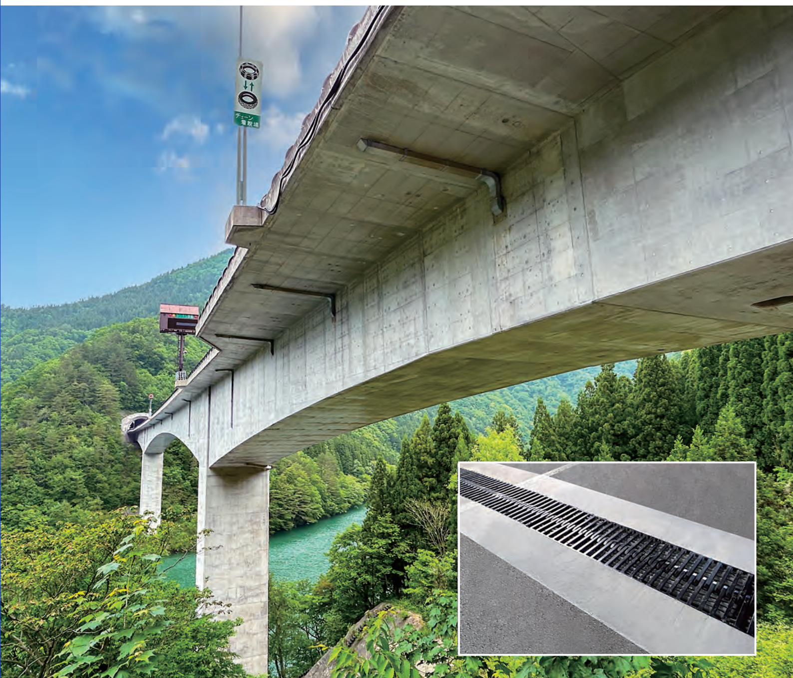
飛越大橋 / 株式会社クリテック工業 ハイブリッドジョイント3LII-350DG