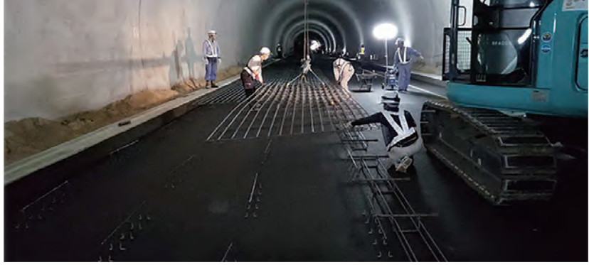
FKメッシュパネル工法